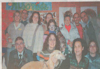
Miembros de la protectora, con algunos de los animales. A. T.

Los voluntarios, además de suscitar el interés y la curiosidad de los visitantes, atendieron cuantas consultas, dudas o sugerencias se les planteaban, tanto por parte del público adulto como por parte de los niños. Con estos últimos se han volcado especialmente, haciéndoles pasar un buen rato pintando sus caras con perros y gatos, enseñándoles a hacer figuras de animales con globos, dejando-